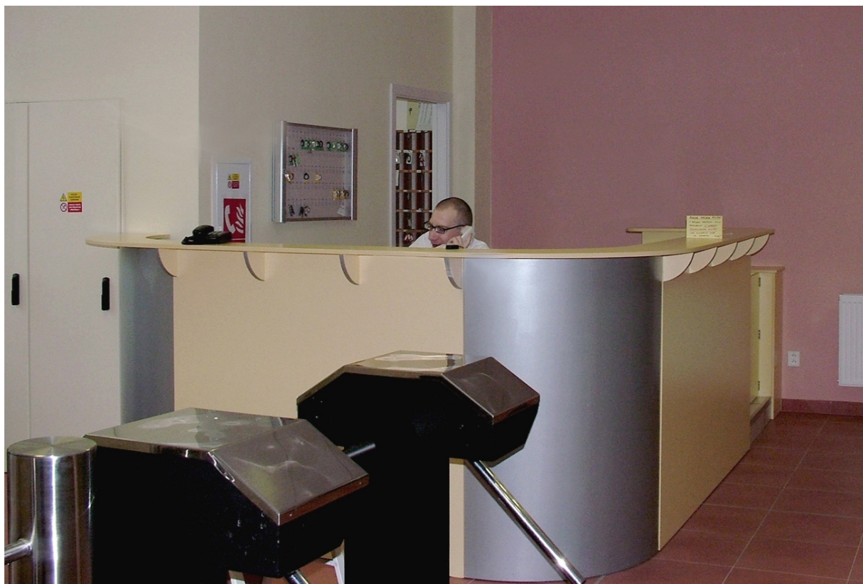
Stav vrátnice po rekonstrukci

Byly zakoupeny tři nová PC a server pro zálohování dat, server pro spuštění e-learningové platformy moodle a dalších webů, které slouží k usnadnění komunikace učitelů se studenty a s veřejností.